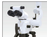
手術用顕微鏡 マイクロスコープ