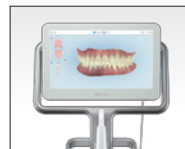
口腔内光学スキャナー iTero エlement2