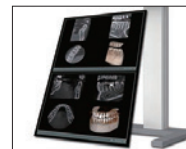
歯科用CT 3D(3次元)レントゲン