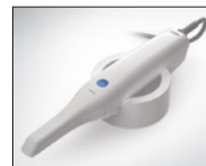
口腔内スキャナー コエックスi500